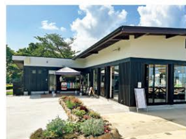
9 展望餐廳 請一邊欣賞最佳景觀，一邊度過用餐時光。