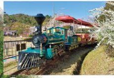
11 SL 弁慶號